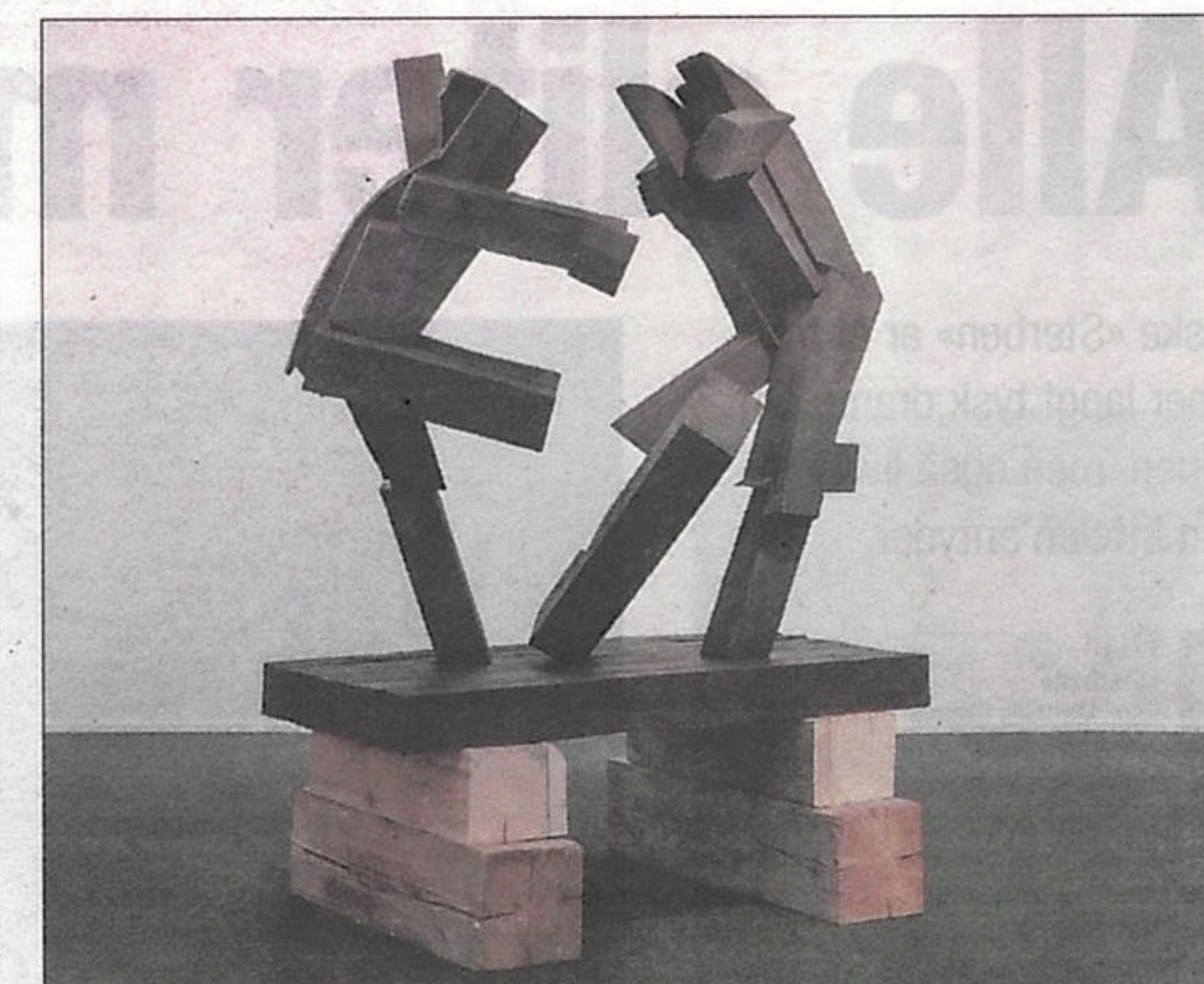
Kristian Blystads «Fritt etter Goya» (2021-24) er hovedverket i den sterke utstillingen i Galleri K.