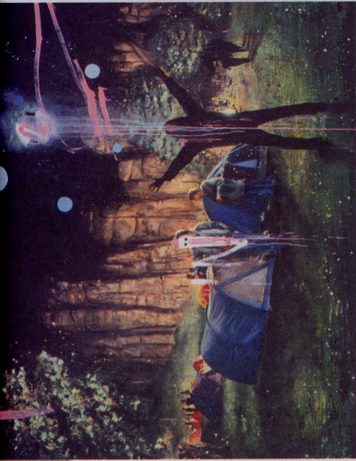
Spøkelsener: «Die Anderen» later til å være en eller annen slags rituell fremkalt ekstase.

Landskapet er jo ikke akkurat utforsket, hippiebevegelsens krasjlanding i et beinhardt 70-tall er allerede gjennomgått ganske grundig. Men her er det faktisk som om det angår oss i et her og et nå. Det er ikke lenger noen som forsøker å stoppe krigen ved å stikke blomster i soldatenes gevær-munninger. De fleste er klar over den dynamikken.